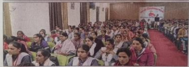
एलबीएस महाविद्यालय में एयरफोर्स की ओर से हुए कार्यक्रम में मौजूद विद्यार्थी।